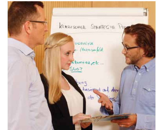
Teilnehmer diskutieren mit dem Trainer zielführende Online-Marketing-Strategien.

Alle Trainer/-innen arbeiten in der freien Wirtschaft, oftmals als Unternehmensberater, und wissen, was Betriebe wollen.