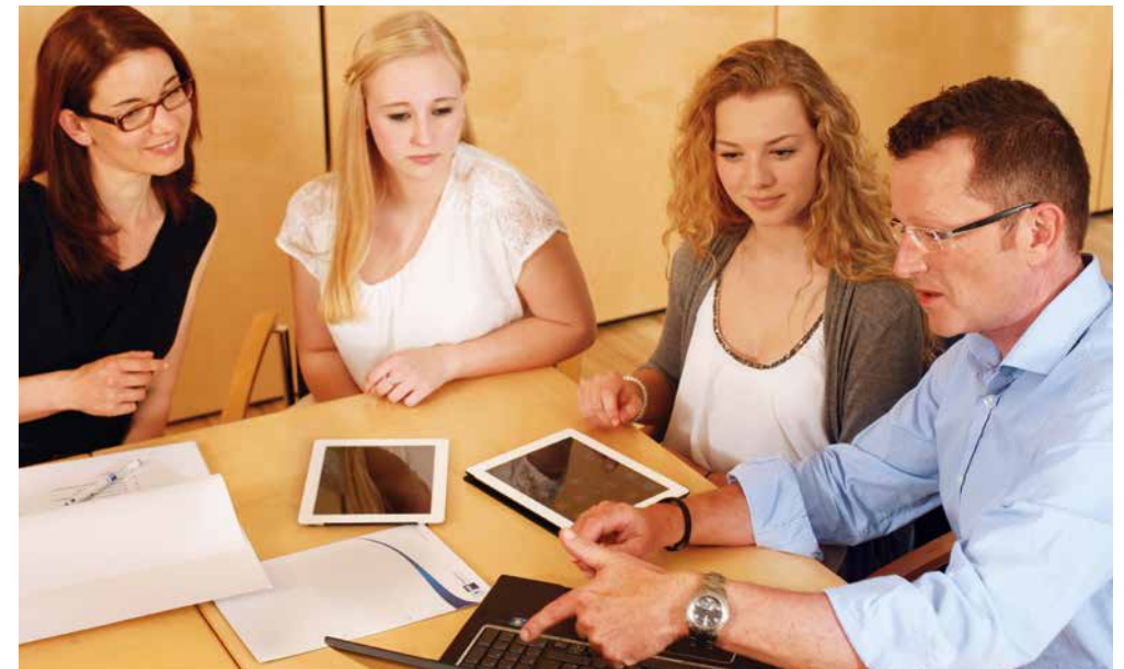
Von der Idee zum verkaufsstarken Online-Text.